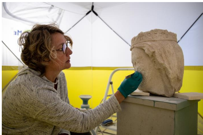
Finition de nettoyage au scalpel