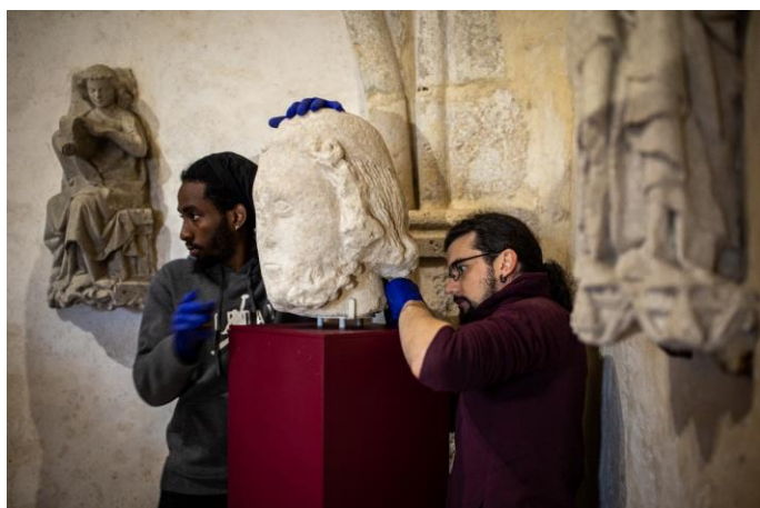
Installation de la sculpture sur le socle - Crédit : Alexandre Gorin