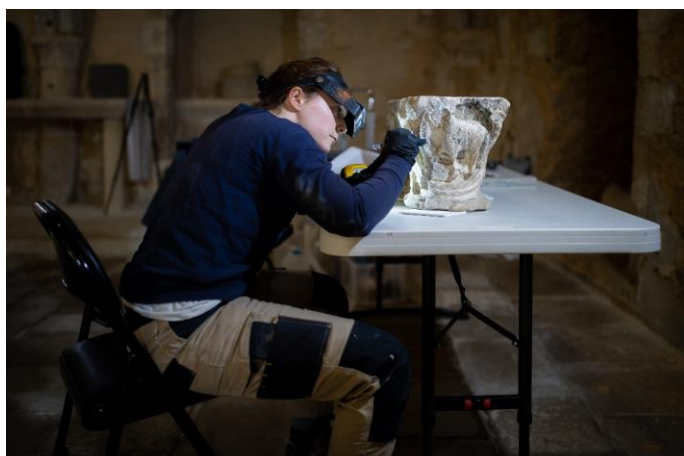
Travail sous lunette-loupe pour le retrait des coulores de cire